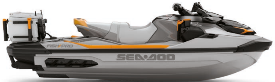
Shark Grey & Orange Crush